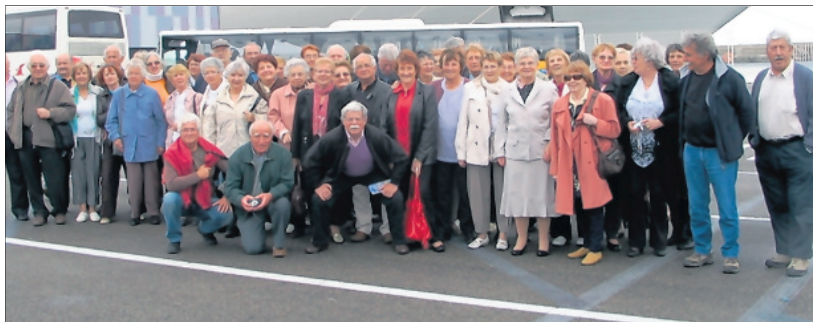
Une journée surprise a été organisée par la section valsoise de l'UNRPA qui a valu son pesant d'or pour les 65 participants. En effet, c'est en direction du port de Marseille que les Vaissois se sont dirigés pour monter à bord du « MSC Fantasia », un navire croisière, le plus grand d'Europe, pour une visite commentée suivie l'après midi par une promenade dans la cité phocéenne. Excellente sortie dans la bonne humeur comme toujours.