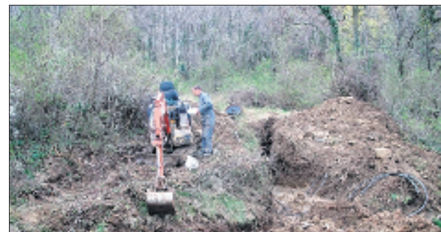
Les travaux en cours sur le réseau d'eau.

Lors de la récente vidange du réservoir alimentant le hameau d'Auriolles en eau, il est apparu que la conduite amenant l'eau depuis la source des Chalade était à refaire. Datant des années 1930, elle était presque entièrement obstruée.