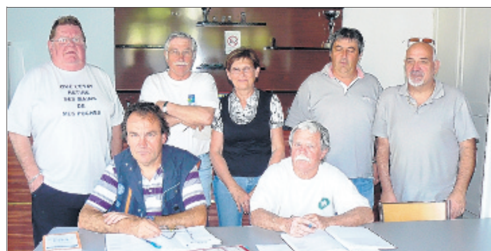
Le bureau de l'AEB peaufine les derniers détails.