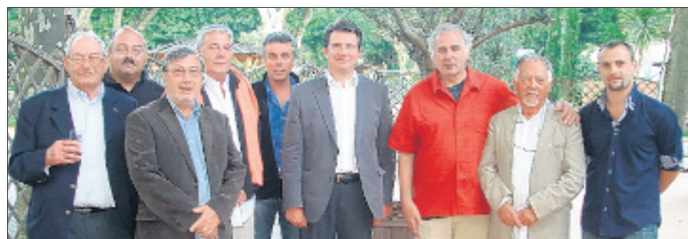
Dans les jardins du Casino, les échanges ont été informels.