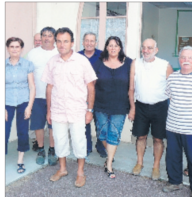
Les bénévoles sont satisfaits des inscriptions.

Inscriptions au boulo-drome 04 75 37 62 25.