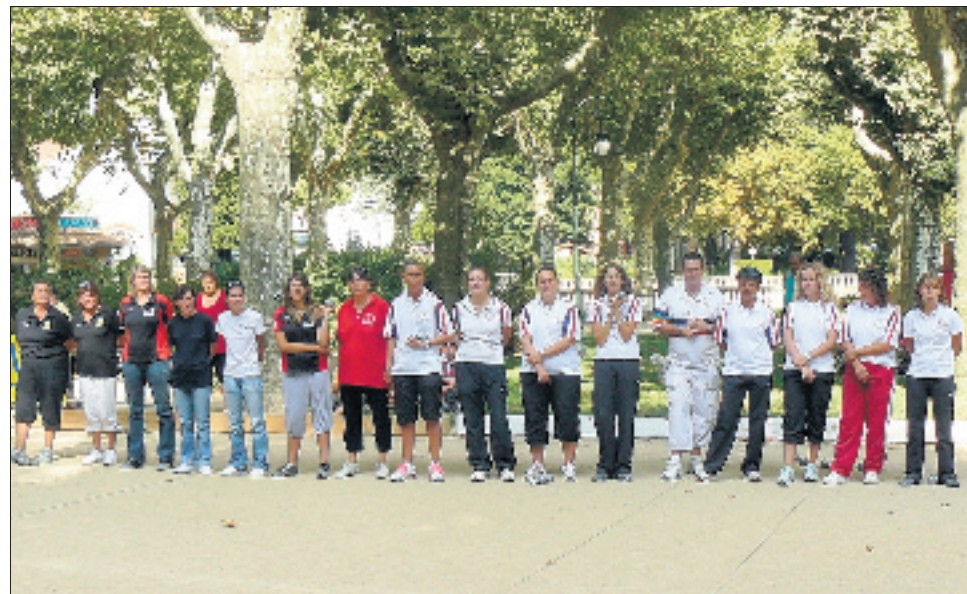
Bruno Le boursicaud, champion du monde entouré de l'équipe de France féminine. La sélection féminine régionale. L'équipe de France et la sélection féminine. Sous les yeux des autorités.

L'équipe de France de pétanque féminines a ravi tout le public lors de la première journée de stage dans le parc du Casino de Vals après deux journées à Antraigues.