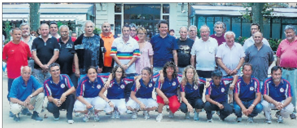
Angélique Papon, championne du monde de tir, Bruno Le Boursicaud, triple champion du monde. La concentration a été travaillé durant le stage. Les élus et partenaires ont apprécié cete rencontre avec les championnes.

Les Valsois ont assisté à deux grandes journées d'exception avec la présence dans le parc du Casino de l'équipe de France de Pétanque Féminine, venue avec le triple champion du monde Bruno Le Boursicaud, effectuer un stage de préparation en vue des championnats du monde en Thaïlande et d'Europe à Düsseldorf en octobre prochain.