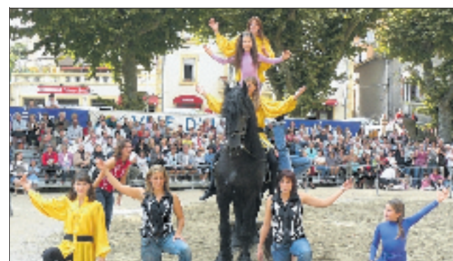
Des numéros de qualité.

La municipalité, via l'Office Municipal des Sports invite une deuxième fois cet été ce samedi 15 août à 21 heures dans le parc du Casino, la troupe de Mercuer « Crinière et Burle ».