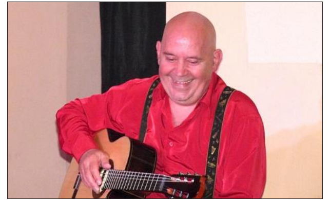
Le comédien Gérard Morel sera à Antraigues-sur-Volane samedi 19 juillet.

Toute la journée sur la place animation ludique et musicale, bouquiniste, orgue de barbarie, groupe Calade en sol. À 16 h 30, à la maison d'Antraigues, rencontre avec le journaliste Pierre-Louis Basse