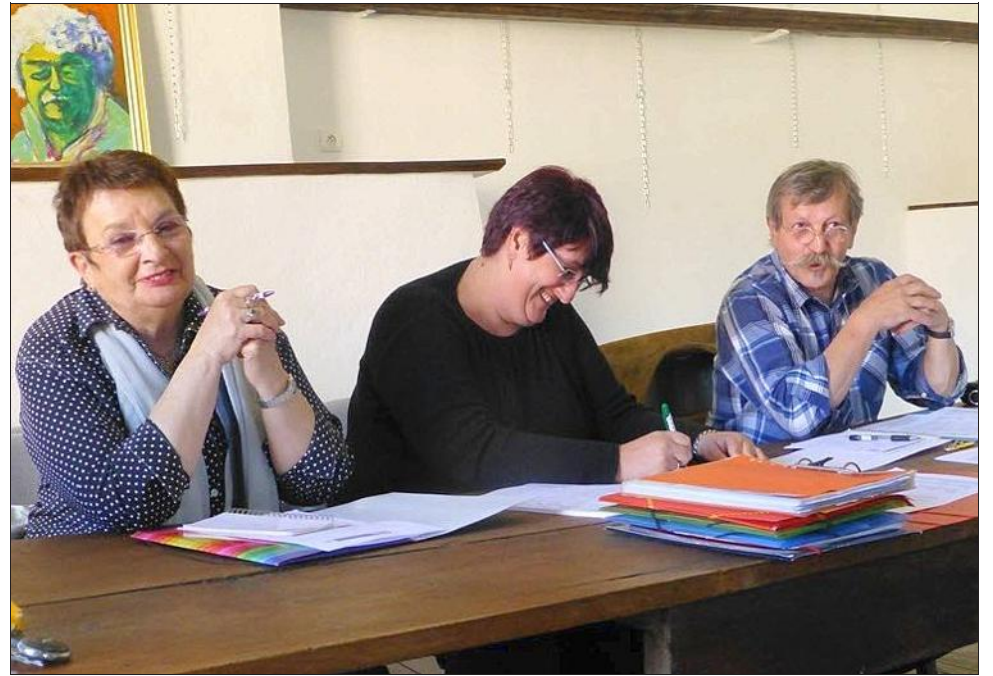
Bonne humeur et sourire dans le camp de l'organisation sur la bonne voie à deux mois du festival

Pour en savoir plus : Infos et réservations 04 75 88 62 92 ou 06 69 44 10 56. Facebook Jean Ferrat culture et chansons à Antraigues