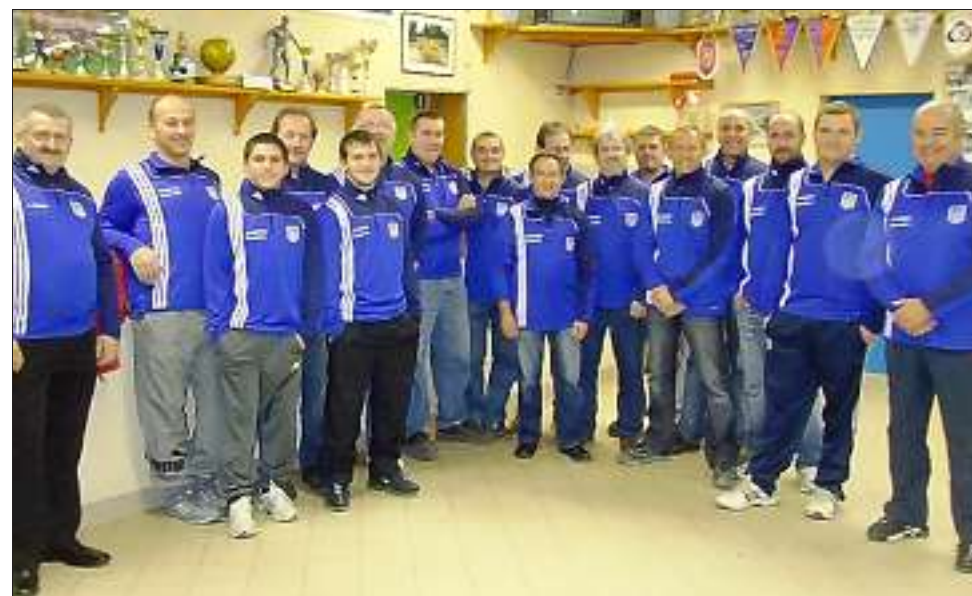
Dirigeants et Educateurs de la JSSP sont prêts pour la deuxième phase. Le club se porte bien avec 223 licenciés, 22 éducateurs, 28 dirigeants et 16 équipes. Le comité directeur souhaite réaffirmer les valeurs du club qui sont solidarité, envie sportive et ambiance conviviale.

C'est la trêve des confiseurs pour les footballeurs du club de la Jeunesse Sportive de Saint Privat. L'occasion de faire un bilan à la mi-saison.