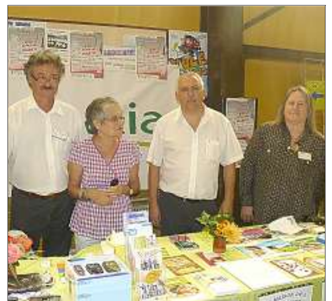
Le bureau n'a pas chômé cette année.