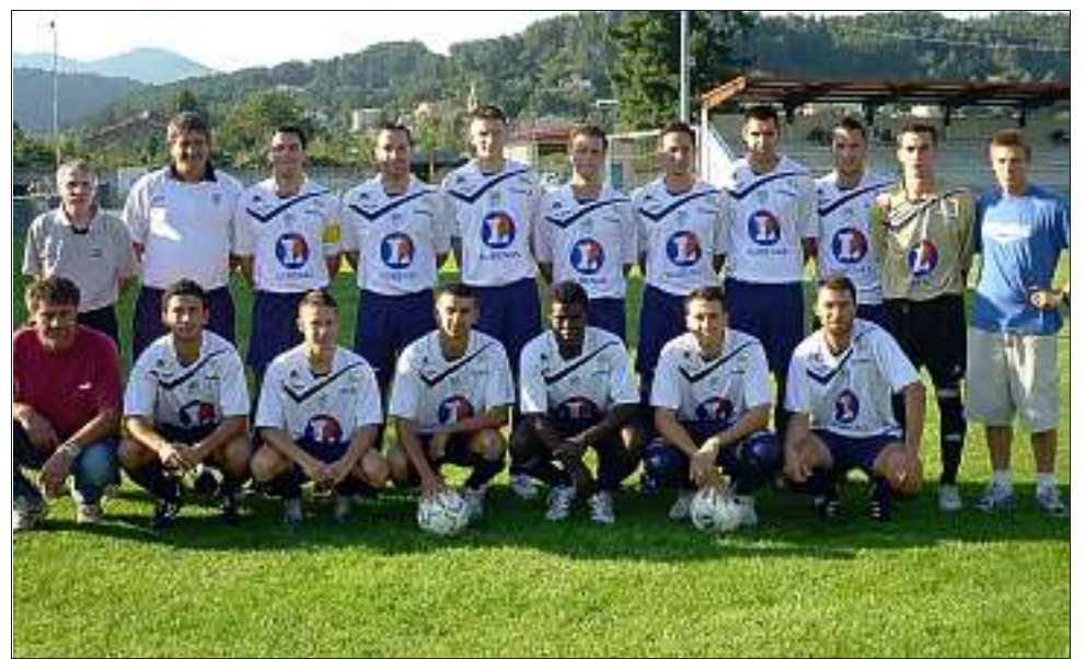
L'Assaf pointe à la 4 e place.

La trêve arrive donc trop tôt pour cette formation qui avait trouvé une bonne carburation. Gageons que les fêtes et la longue trêve n'enraillent pas la machine.