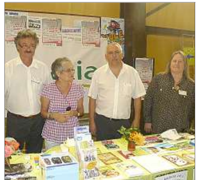
Le bureau n'a pas chômé cette année.