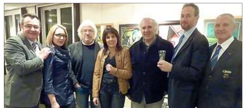
Les artistes très entourés par leurs hôtes ambassadeur de l'OPEN INTERNATIONAL

pion du monde, ambassadeur des boules dans le monde et instigateur de l'événement était heureux de cette première opération : « Cette exposition a permis de nouveaux et très