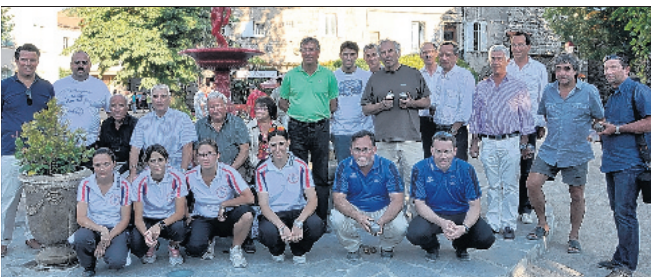
Un gentlemen disputé sur la place de la résistance d'Antraigues-sur-Volane, en présence d'élu et de chefs d'entreprises.